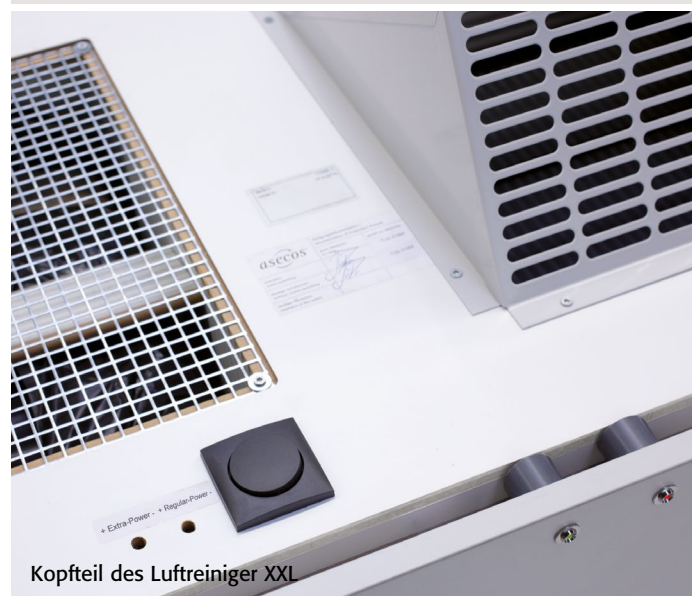
Kopfteil des Luftreiniger XXL