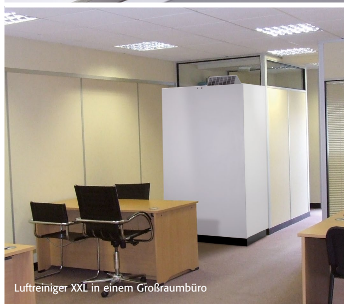
Luftreiniger XXL in einem Großraumbüro