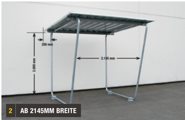
2 AB 2145MM BREITE