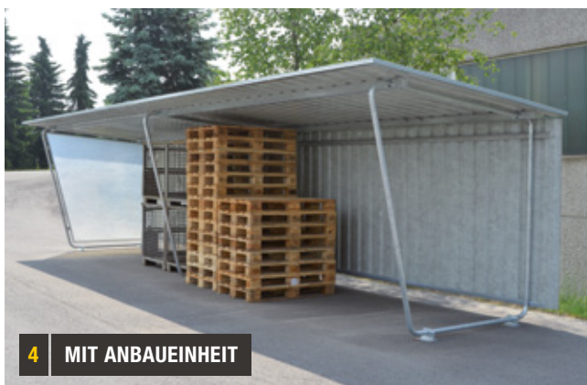
4 MIT ANBAUEINHEIT