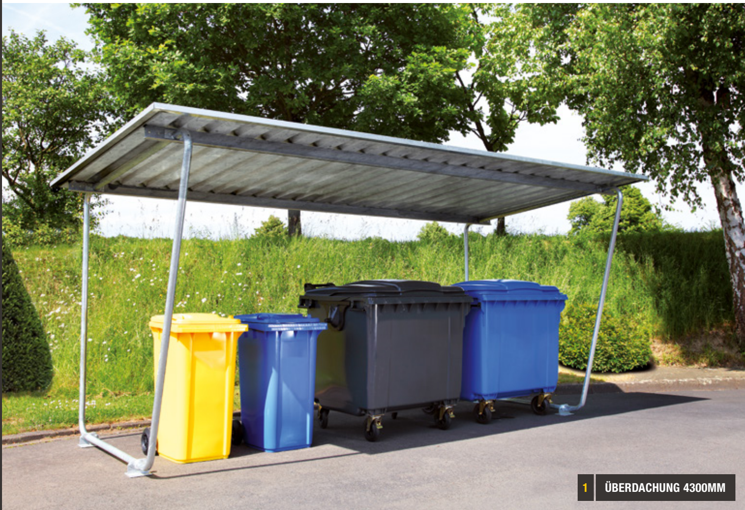
1 ÜBERDACHUNG 4300MM